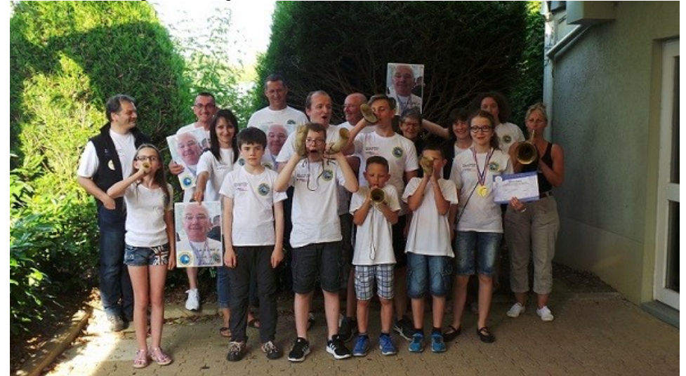
Déplacement Championnats de France École de tir à Montbéliard Juillet 2016

École de Tir: Jeunes de 8 à 14 ans* encadrés par 3 à 5 adultes le mercredi de 13h30 à 16h45 «en 1 ou 2 séances de 1h30 suivant le nombre de participants». Tir aux armes à air comprimé uniquement.